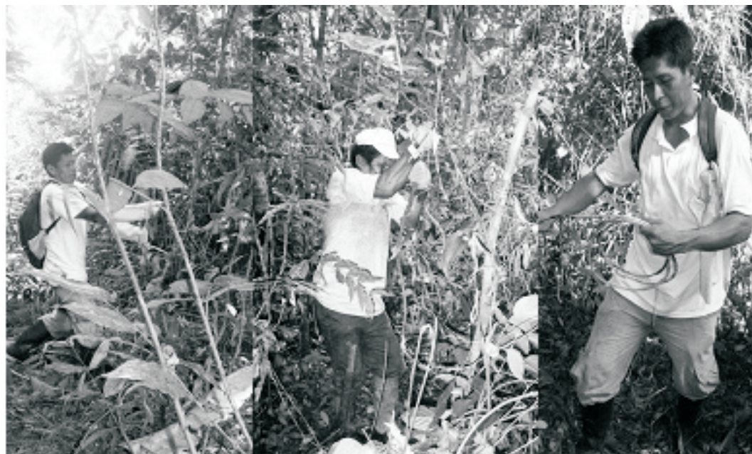
Figura 1. Proceso de extracción de los estípites aprovechables de cashavara Desmoncus polyacanthos sin manejo de los estípites remanentes

Las fibras obtenidas son producto de la cosecha de los estípites maduros y son destinados al mercado local para su utilización en artesanías o cestería. En las ciudades mayores son usadas en la industria de muebles principalmente como complemento de los espaldares y asientos conocidos como “esterillados”. La extracción artesanal consiste en cortar el estípite en la base y jalarlo hasta dejarlo caer al suelo. Luego mediante una clasificación se separa la parte aprovechable (desde la base hasta la parte madura), posteriormente se quita la corteza exterior conjuntamente con las espinas que se encuentran en el estípite (Figura 1). Este proceso de extracción tradicional no tiene en cuenta la clasificación de los estípites presentes en la mata, tampoco alternativas de manejo de los estípites remanentes. En este sentido el presente estudio tuvo como objetivo generar información sobre técnicas de cosecha sostenible para el manejo de cashavara en la Amazonía Peruana y de esta forma contribuir a la conservación de la especie.