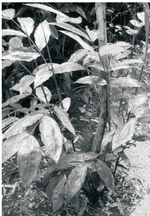
Figura 4. Planta de cashavara Desmoncus polyacanthos con buen vigor.