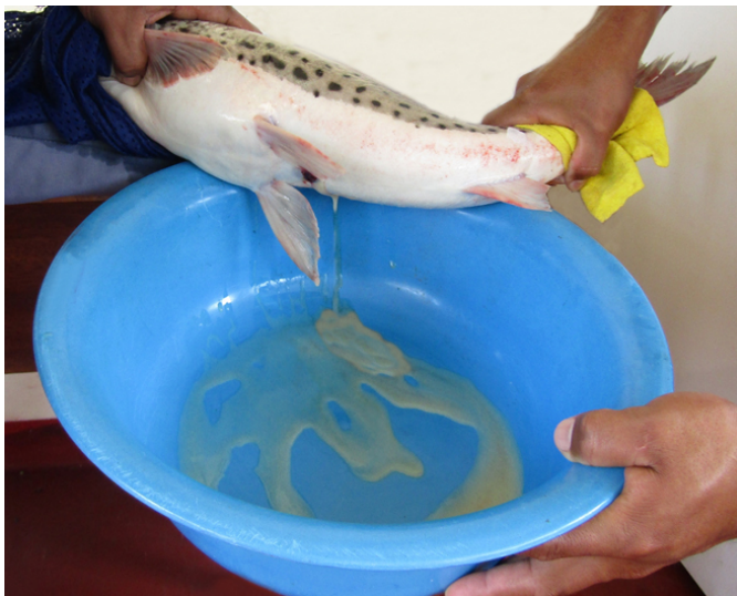
Figura 1: Desove de óvulos de Calophysus macropterus Lichtenstein, 1819 post inducción hormonal.

con el semen de los machos bajo el mismo método de masaje abdominal usado en las hembras. La incubación se realizó en incubadoras cilindro cónicas de flujo ascendente tipo Woynarovich de 60 L de capacidad con un flujo de agua de 3 L/min. Una vez culminada la eclosión de las larvas fueron colectadas y contabilizadas.